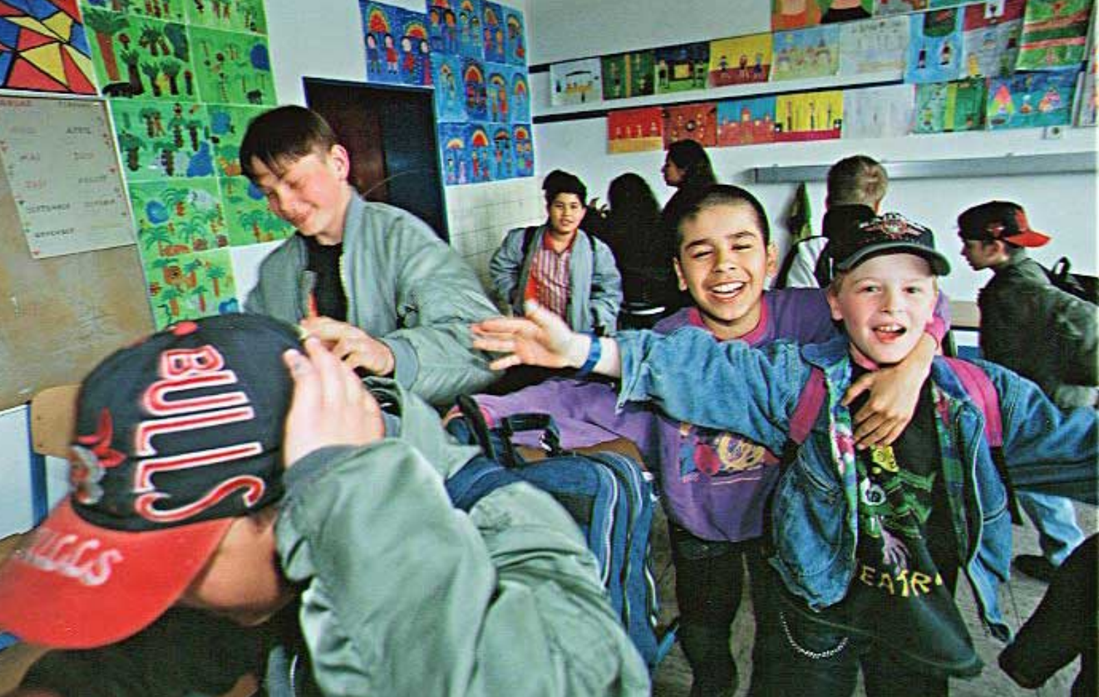
Sophienschüler der Klasse 5 vor Unterrichtsbeginn: Die Schule ist einzige feste Größe, Treffpunkt, Zuhause