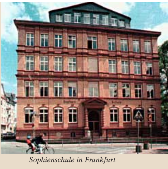
Sophienschule in Frankfurt

Sabit müßte eigentlich auch da draußen stehen. Statt dessen sitzt er in einer der Intensivklassen für Neuankömmlinge und