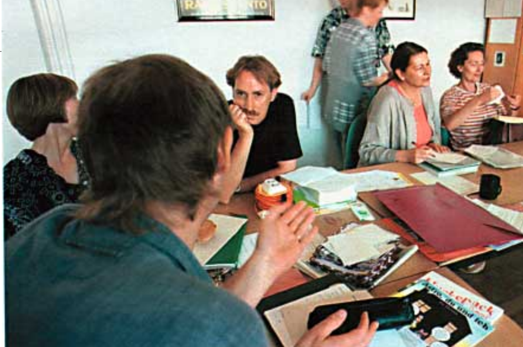
Pausenkonferenz im Lehrerzimmer*: „Andere pädagogische Maßnahmen“

Im Jungenklo rauchen 10 bis 15 Jungen und Mädchen ihre Zigaretten, viele sind